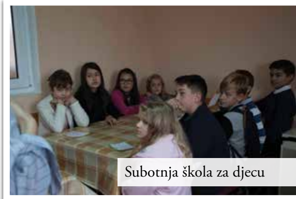
Subotnja škola za djecu