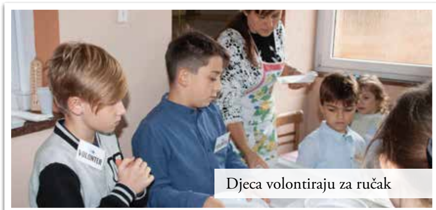
Djeca volontiraju za ručak